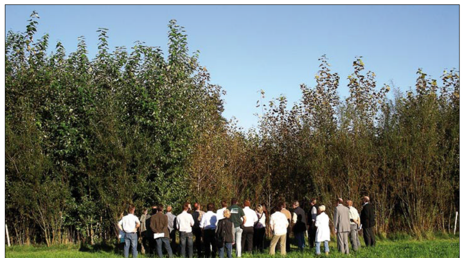
Abb. 3: Bei der Besichtigung der Versuch- und Sortenprüfflächen im Raum Teisendorf wurde deutlich, wie wichtig die richtige Sortenwahl und Sortenprüfung für den wirtschaftlichen Erfolg ist.

Bei der Exkursion und Besichtigung der Versuch- und Sortenprüfflächen im Raum Teisendorf wurde deutlich, wie wichtig die richtige Sortenwahl und Sortenprüfung für einen wirtschaftlichen Erfolg ist. Die vorhandenen Prüfflächen und das „Know-how“ am ASP Teisendorf sind insbesondere auch einer langfristigen angelegten Forschungspolitik zu verdanken. So wurde die Sortenprüfung von Pappelklonen in Bayern auch in Zeiten geringer Nachfrage nicht völlig aufgegeben, sodass die heimische Land- und Forstwirtschaft nun von den entsprechenden Versuchsergebnissen und Mutterquartieren profitieren kann. ◀